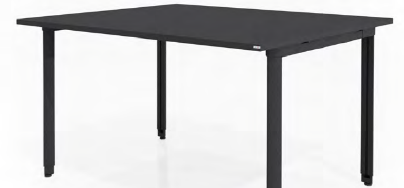
Gestell G4 in schwarz struktur; Anti-Fingerprint Schwarz matt als Plattenfarbe Frame G4 in black structure; top anti-fingerprint matt black