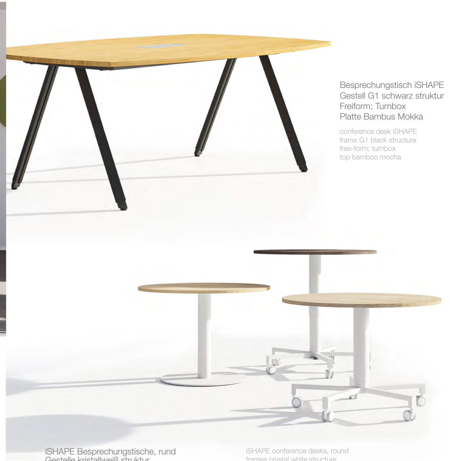
Besprechungstisch iSHAPE Gestell G1 schwarz struktur Freiform; Turnbox Platte Bambus Mokka

Communication areas, conference rooms and meeting points are becoming increasingly important for efficient and meaningful work processes. Working together promotes fast and thoughtful work processes and ensures a better climate in the office.