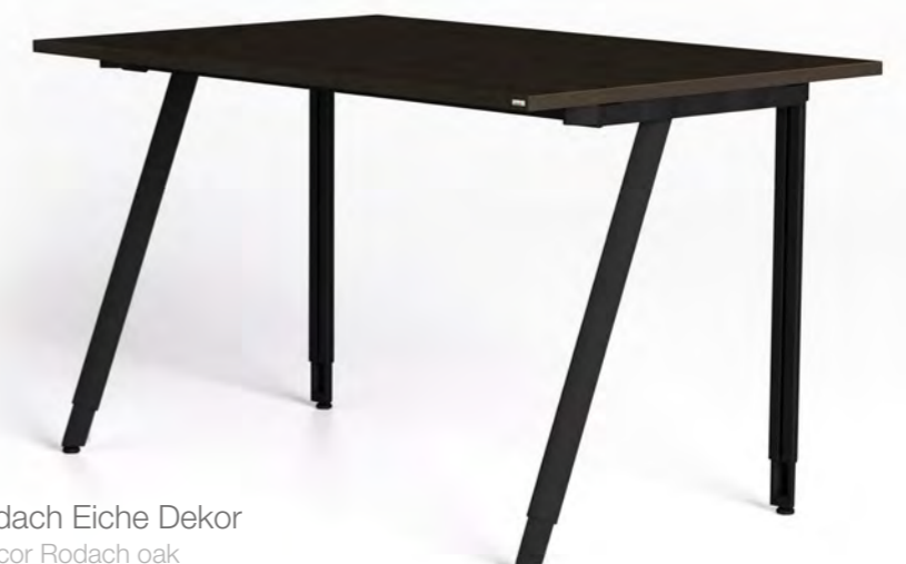
G2 Gestell schwarz struktur; Platte Rodach Eiche Dekor frame black structure; top synchronous decor Rodach oak