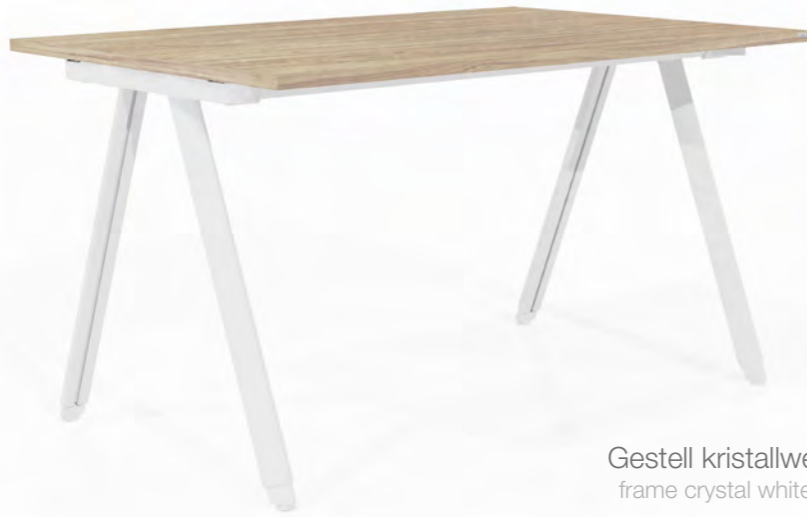
G1 Gestell kristallweiß struktur; Platte Coburg Ulme Dekor frame crystal white structure; top synchronous decor Coburg elm

iSHAPE Tischform G1 schwarz struktur; Platten Anti-Fingerprint Schwarz matt. Schränke und Türen iSCUBE kristallweiß. Lounge-möbel iPOINT mit hoher Lehne. Kabelschlangen schwarz. Waldmann Arbeitsplatzleuchten PARA.MI schwarz und Stehleuchte LAVIGO weiß; Götessons Monstera im Topf. Klöber Bürostühle „Connex2“. Produkte sind über LEUWICO erhältlich.