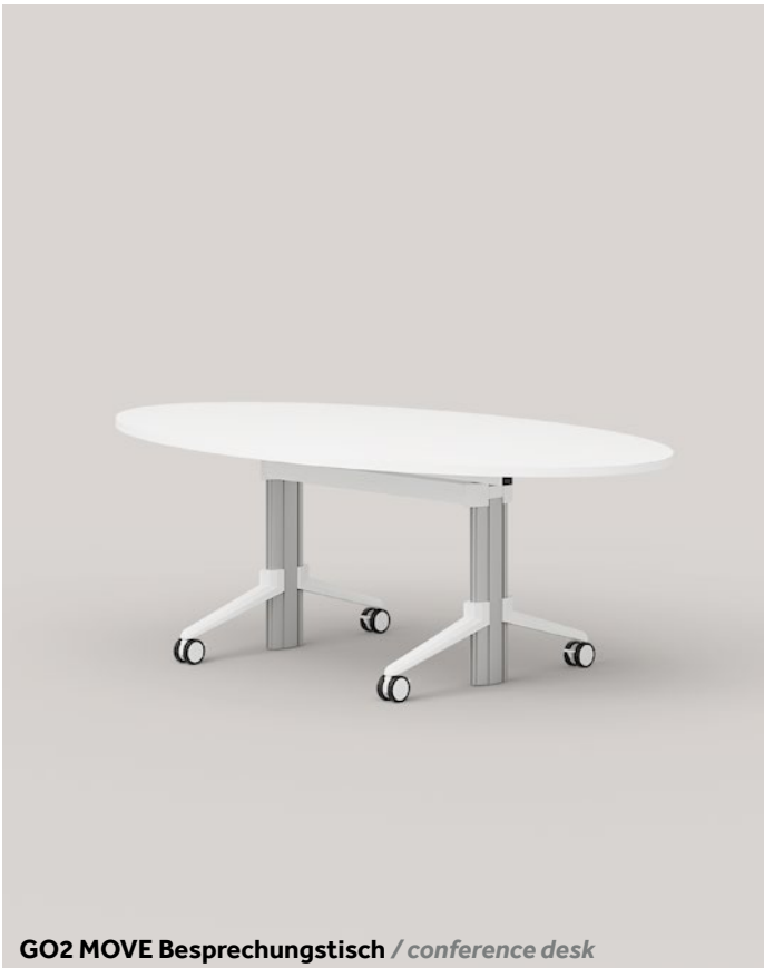
GO2 MOVE Besprechungstisch / conference desk