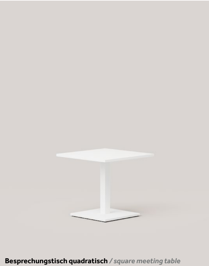
Besprechungstisch quadratisch / square meeting table