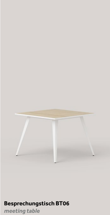
Besprechungstisch BT06 meeting table