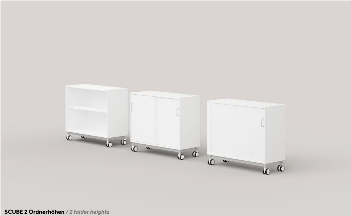
SCUBE 2 Ordnerhöhen / 2 folder heights