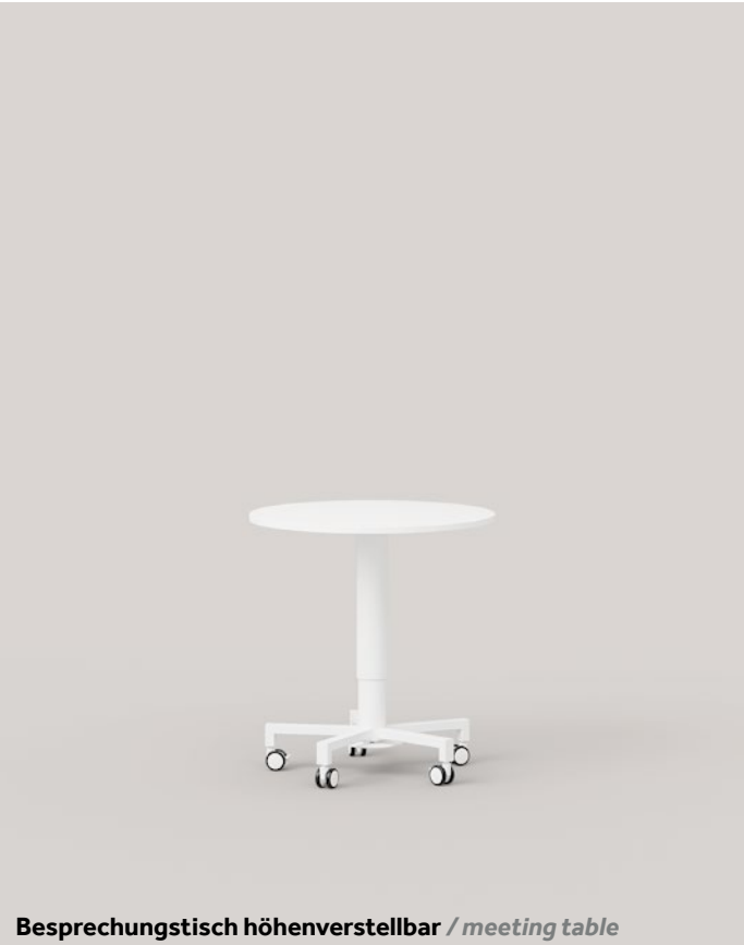
Besprechungstisch höhenverstellbar / meeting table