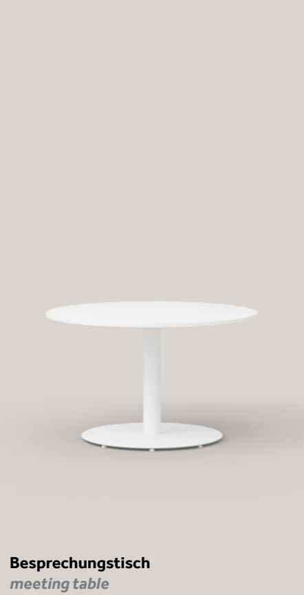
Besprechungstisch meeting table