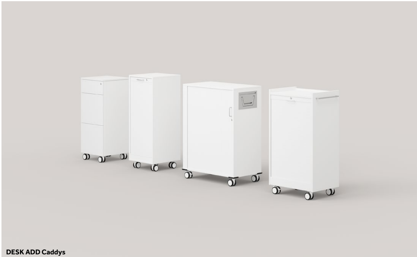
DESK ADD Caddys