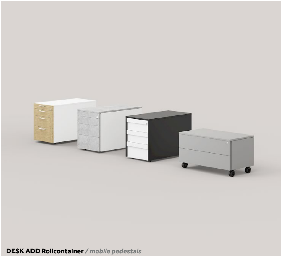
DESK ADD Rollcontainer / mobile pedestals

Various configurations and sizes available.