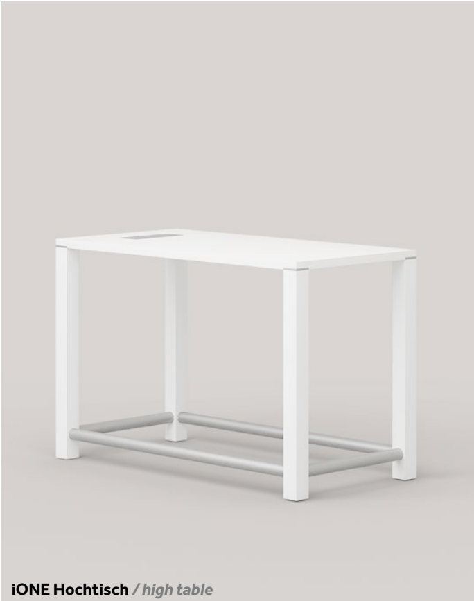
iONE Hochtisch / high table