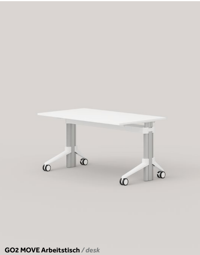
GO2 MOVE Arbeitstisch / desk